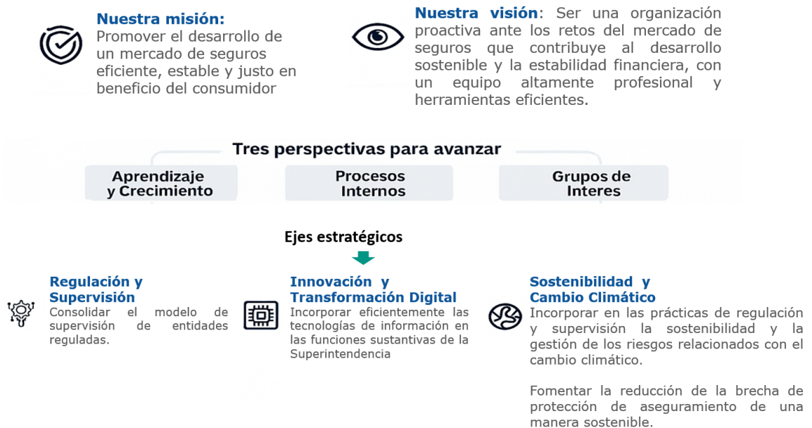
Figura 1 Plan Estratégico 2024-2028

Para el logro de los objetivos estratégicos se plantean iniciativas, que se ejecutarán a lo largo del quinquenio, estas iniciativas pueden ser planteadas como una acción o un proyecto estratégico.